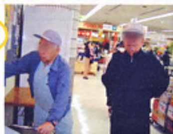
お二人はいつも仲の良い親友コンビです♪