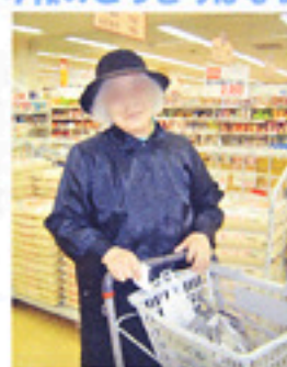
女性はカートを押す姿もさまになりますね～今夜のごちそうはなまに？